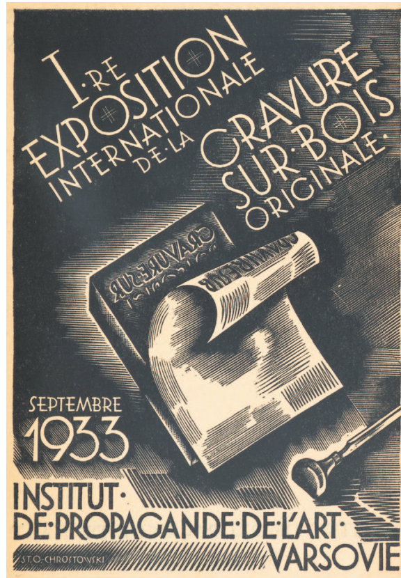
Il. 3. Drzeworyt Stanisława Ostoi-Chrostowskiego, źródło: Pierwsza Międzynarodowa Wystawa Drzeworytów w Warszawie , katalog, Instytut Propagandy Sztuki, Warszawa 1933

Jak się okazało, kilka dni później miał on okazję skonfrontować opinię wyrobioną na podstawie katalogu z rzeczywistością 15 . „Bardzo ciekawa wystawa drzeworytów w I.P.S. [Instytucie Propagandy Sztuki - K. G.] [...] drzeworyty rosyjskie są interesujące,